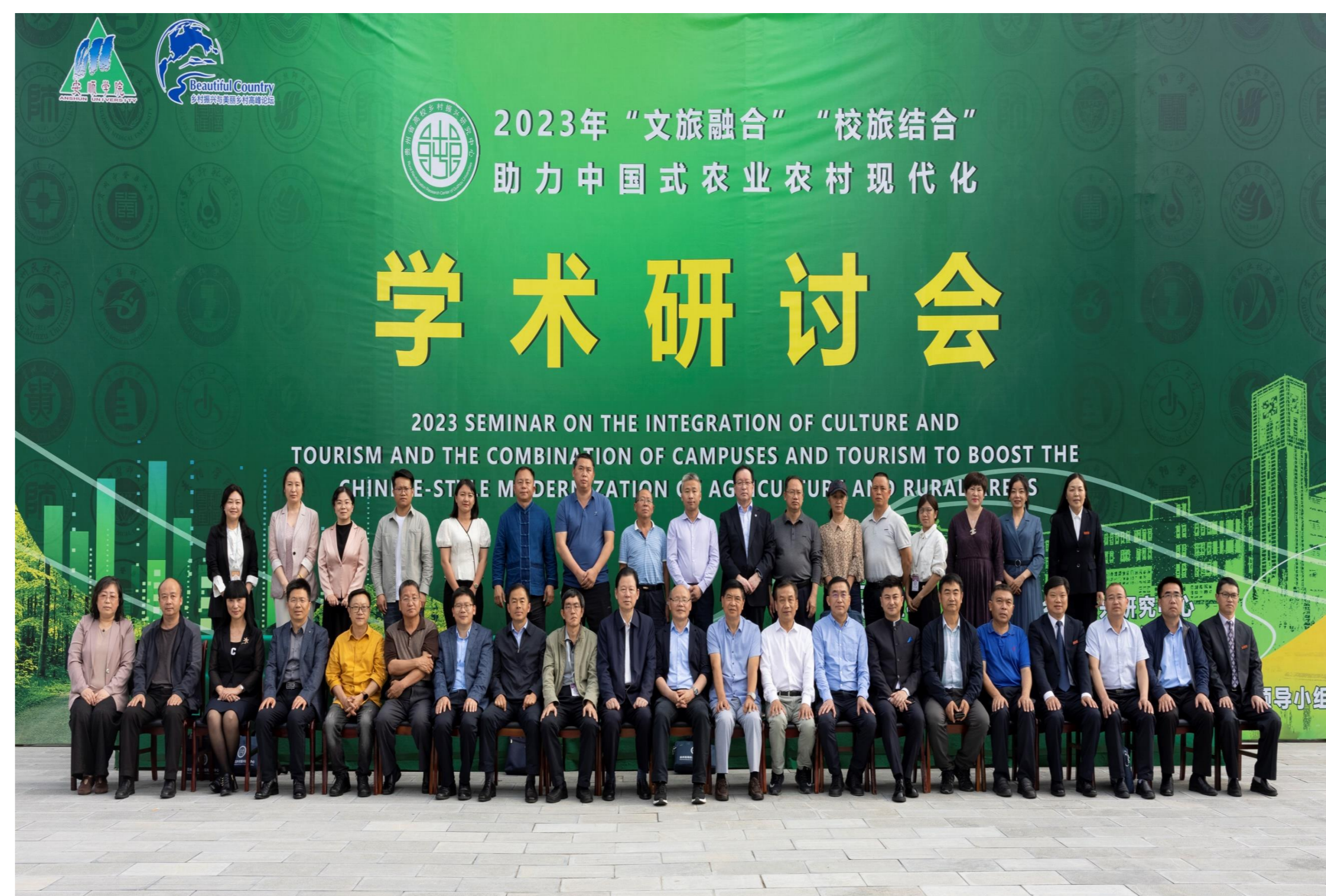
2023年5月18日，安顺学院举办“文旅融合”“校旅融合”助力中国式农业农村现代化学术研讨会