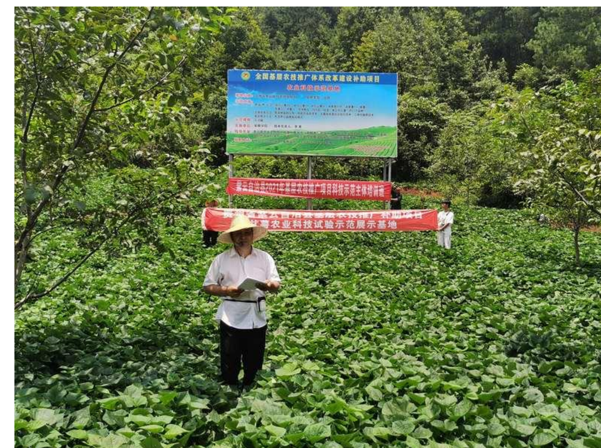
安顺学院农业产业帮扶基地 (贵州省高校乡村振兴助农成果)