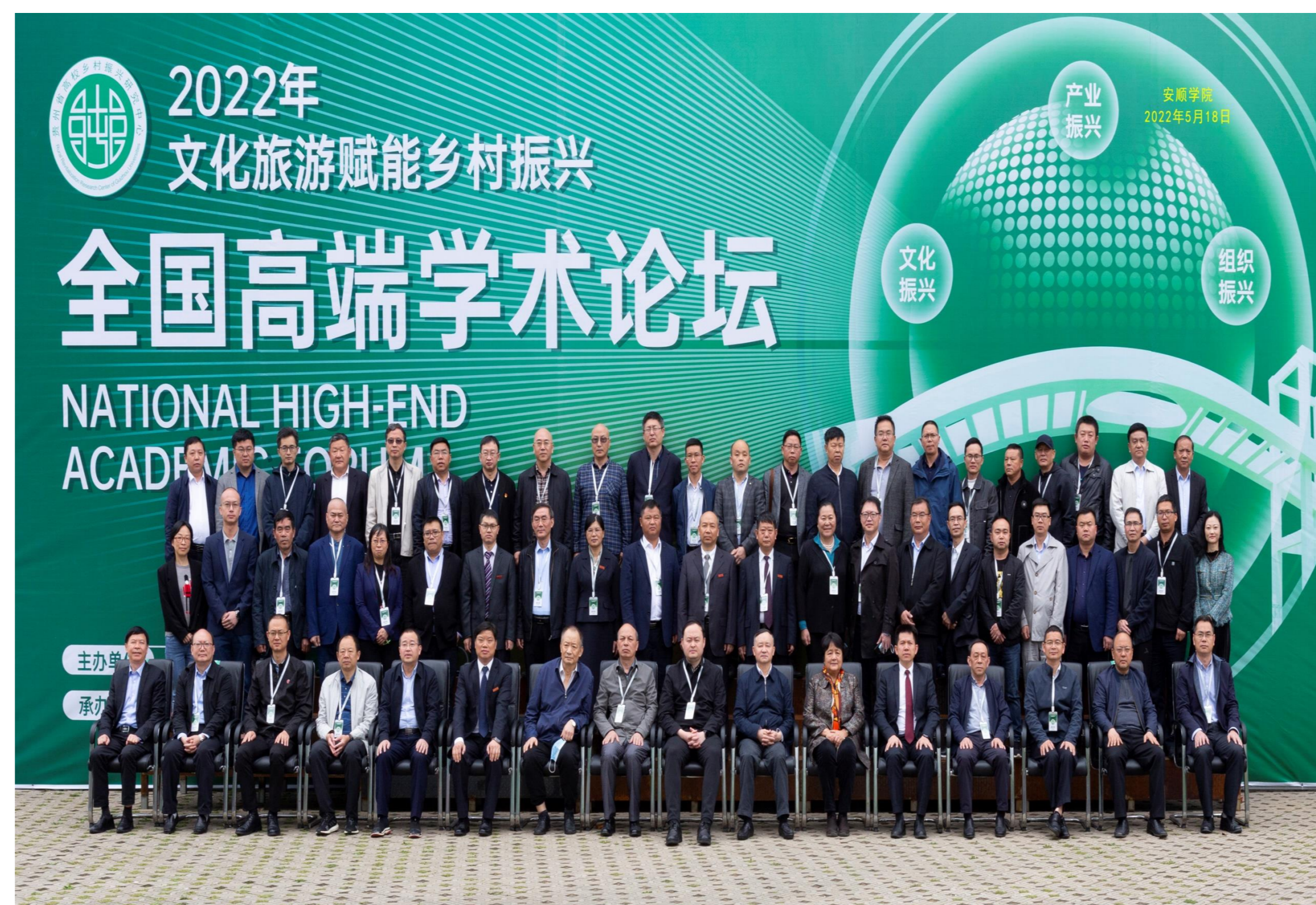
2022年5月18日，安顺学院举办文化旅游赋能乡村振兴全国高端学术论坛