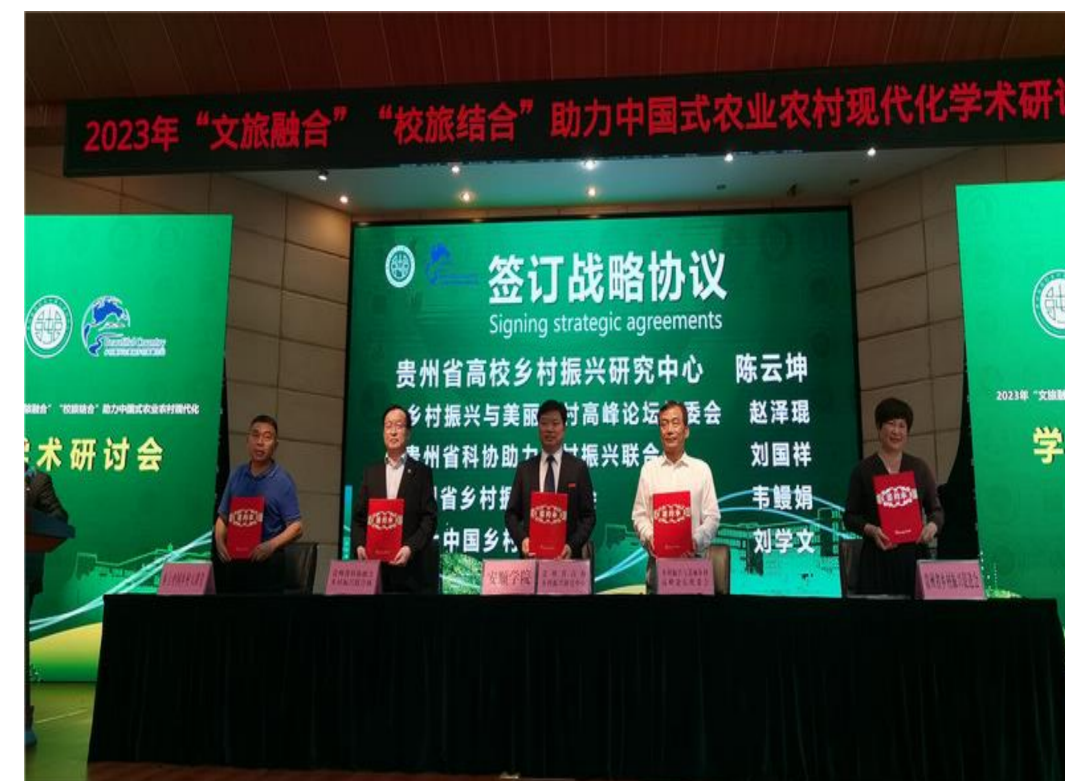
2023年5月18日，贵州省高校乡村振兴研究中心、贵州省高校乡村振兴研究中心与乡村振兴相关机构开启跨界合作