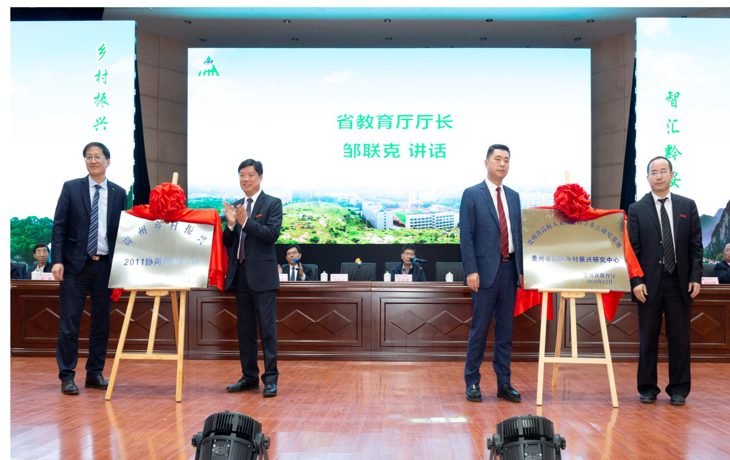
2021年5月18日，贵州省高校乡村振兴研究中心在安顺学院揭牌