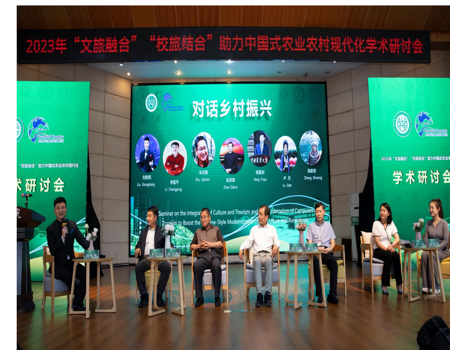
2023年5月18日，各领域代表与主持人围绕贵州乡村振兴发展未来开展对话活动