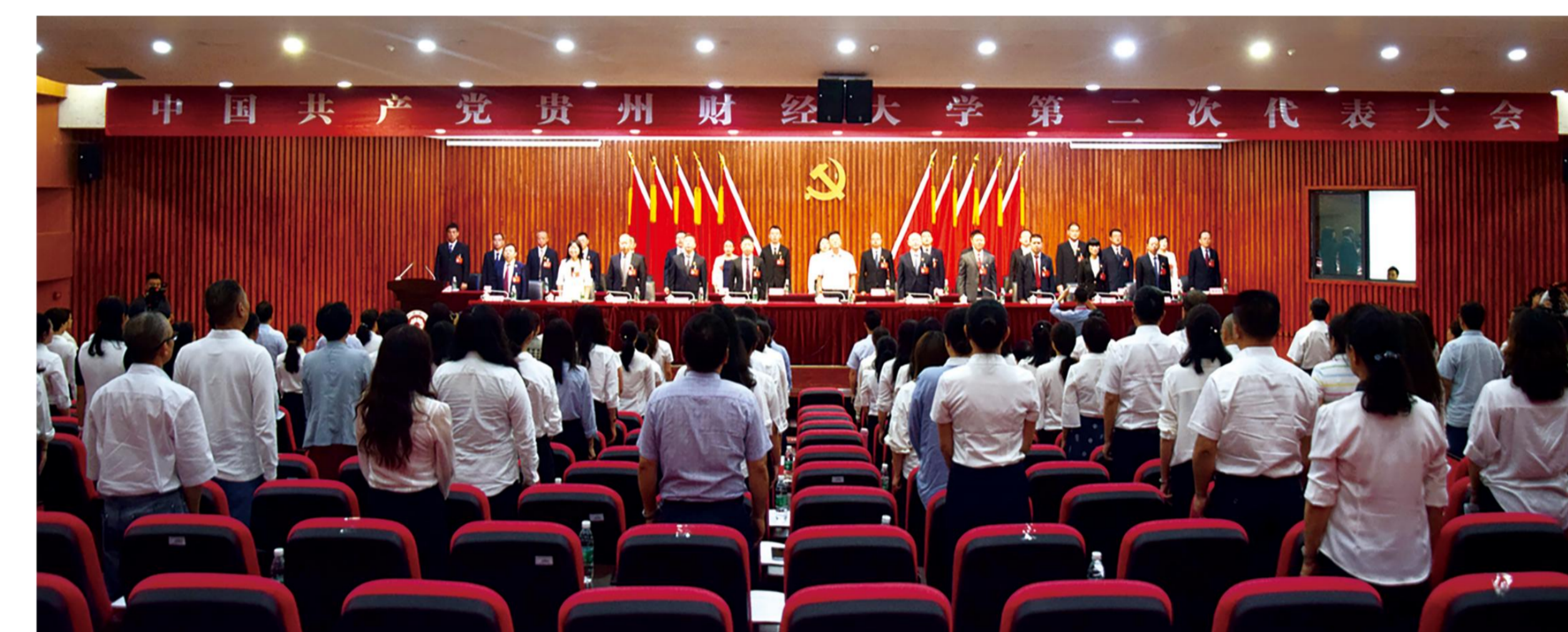
中国共产党贵州财经大学第二次代表大会召开

2020年9月10日，贵州财经大学第二次党代会召开，提出“一个中心、两大工程、三化同步”发展战略，加快“双一流”建设，为全面建成有特色高水平财经大学持续不懈奋斗！