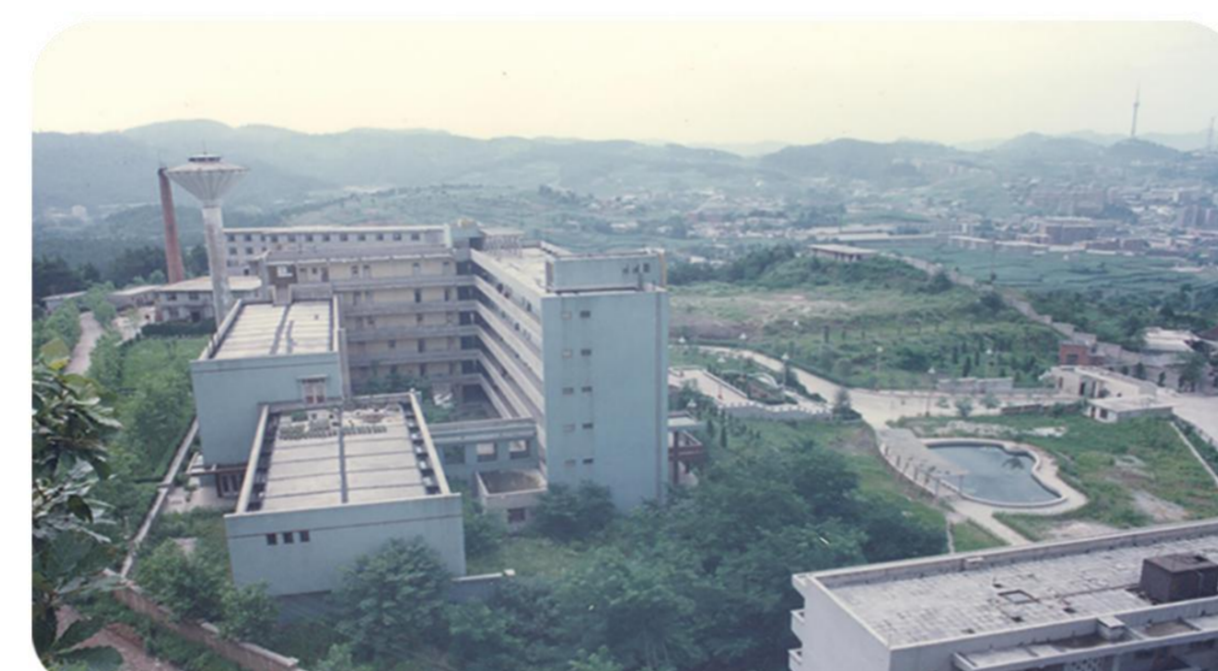
1992年计划管理干部学院合并到贵州财经学院，图为当时的鹿冲关校区