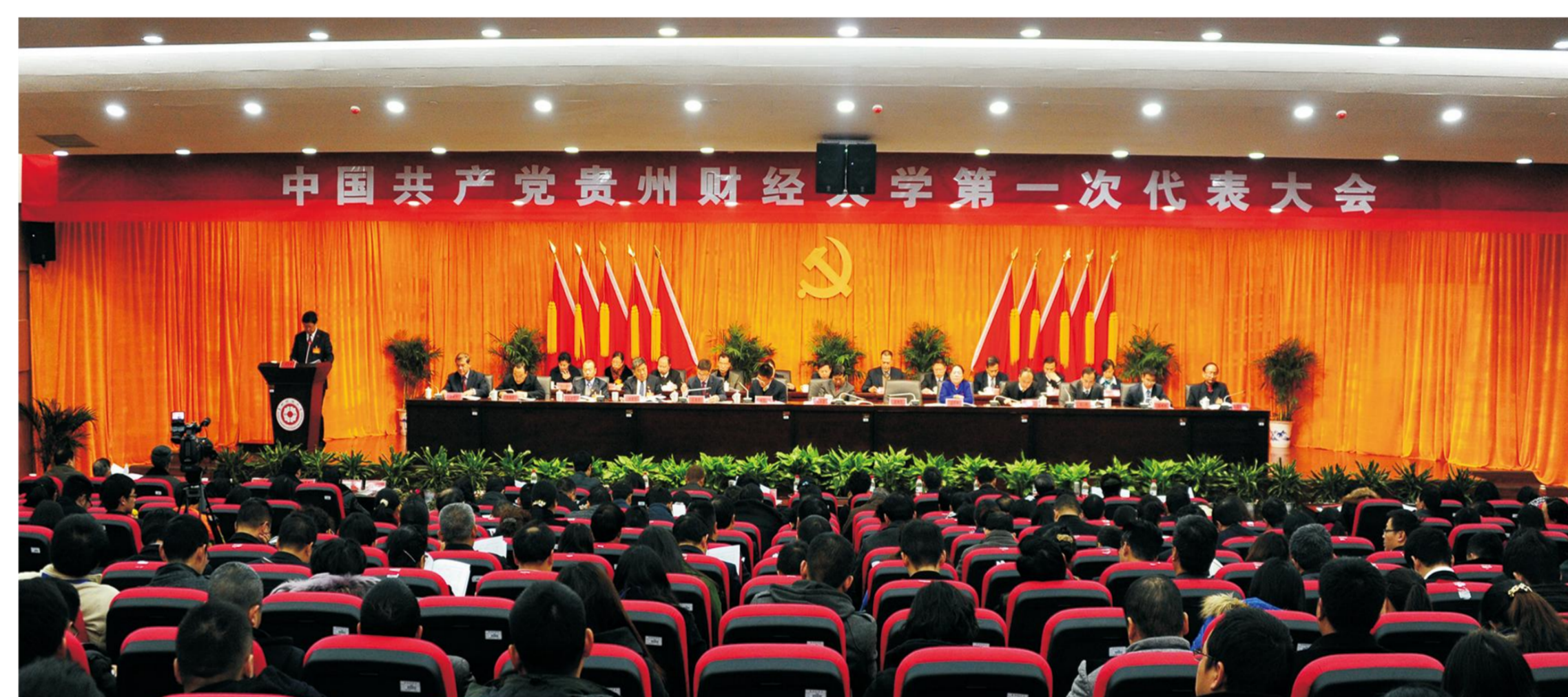
中国共产党贵州财经大学第一次代表大会召开

2014年12月27日，贵州财经大学第一次党代会召开，大会确立了“一个主基调、两个发展极、三个着力点、四个新维度”的发展战略，提出了全面建成有特色、高水平财经大学的奋斗目标。