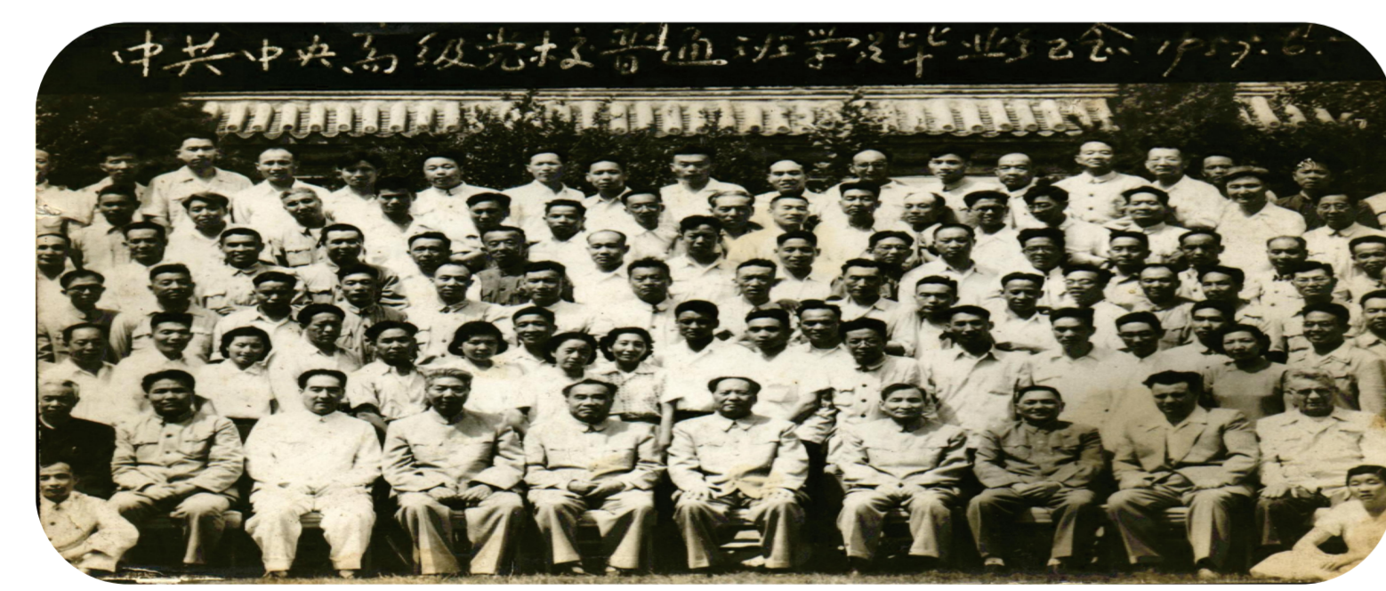
1959年6月，我校原院长胡松坡在中央党校普通班学习时与毛泽东主席等国家领导人合影