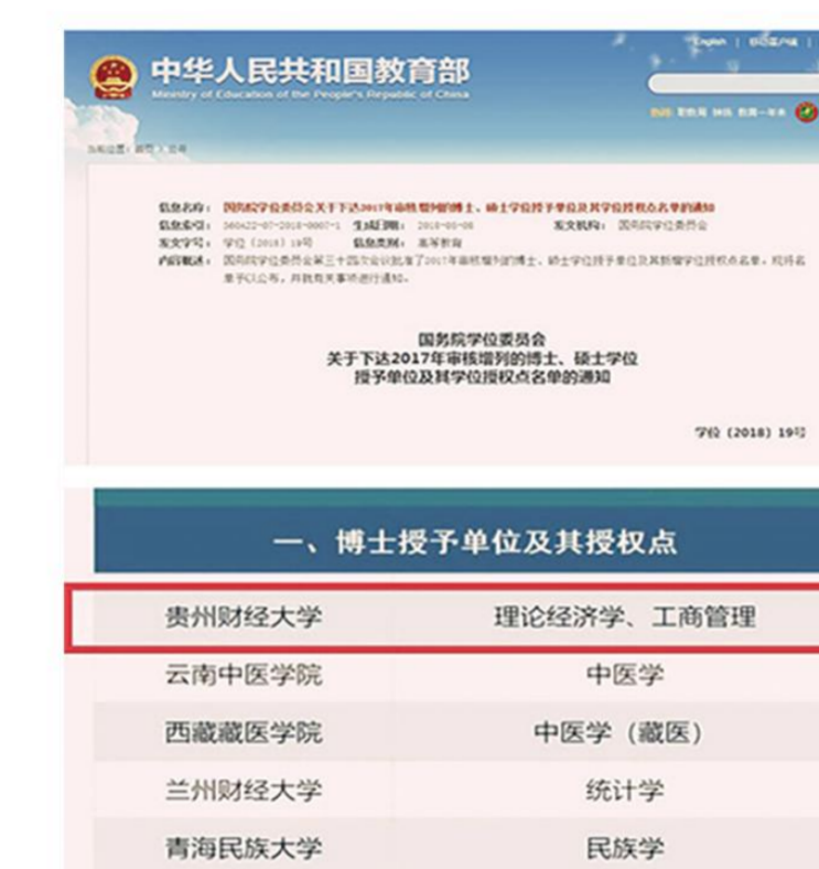
2018年 我校获批博士学位授予单位