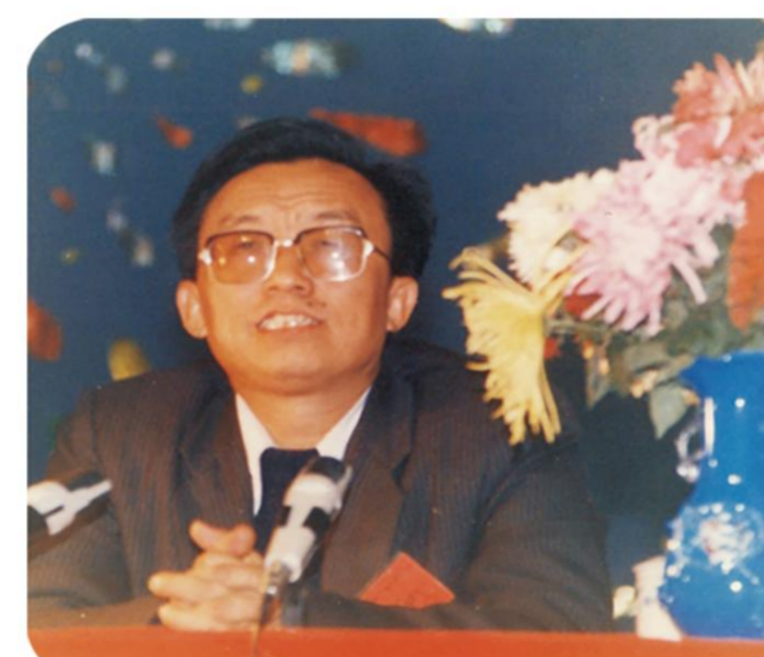
30年校庆时任省委副书记丁廷模出席庆典会并题词