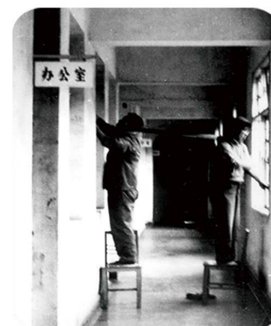
复校初期的办公室