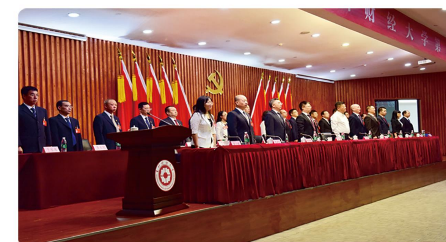
中国共产党贵州财经大学第二次代表大会召开