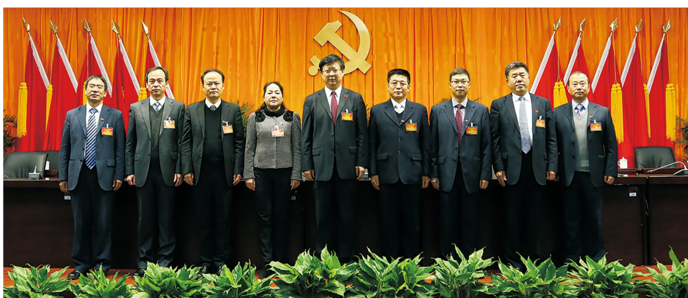
中国共产党贵州财经大学第一次代表大会选举产生新一届党委委员