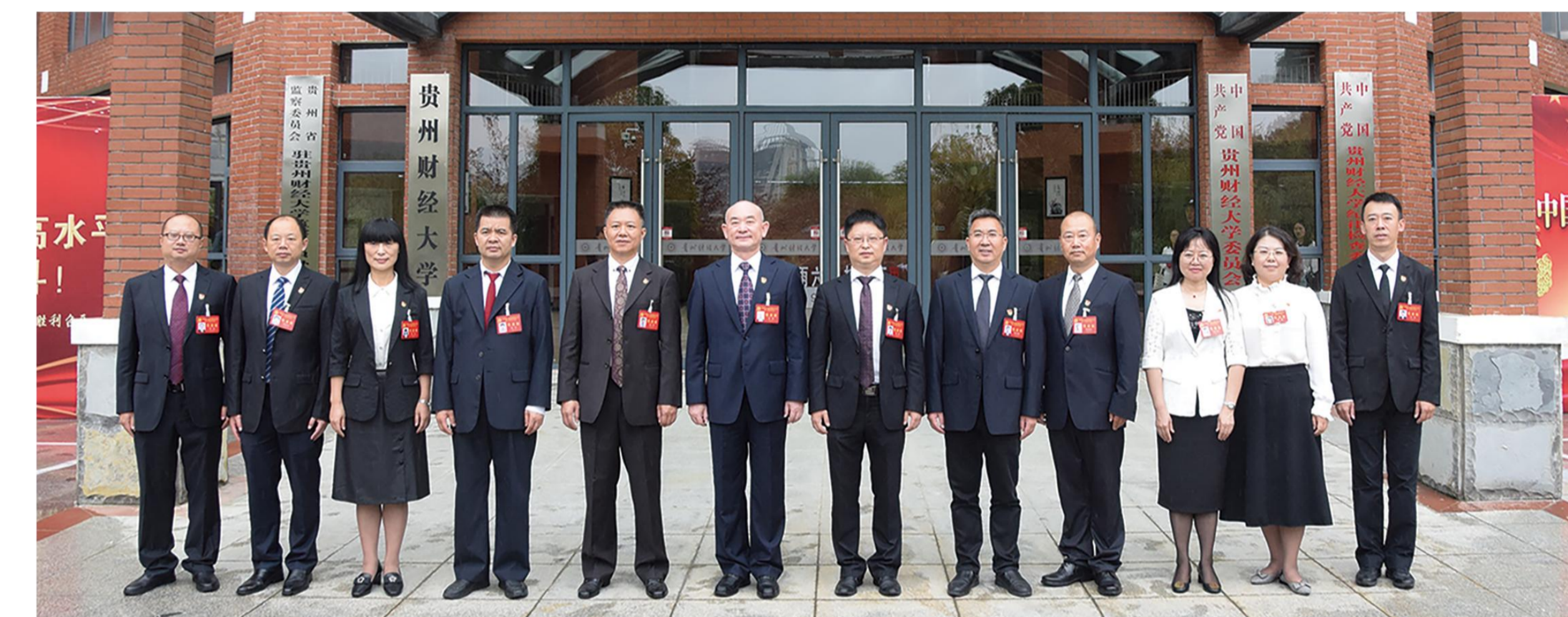
中国共产党贵州财经大学第二次代表大会选举产生新一届党委委员