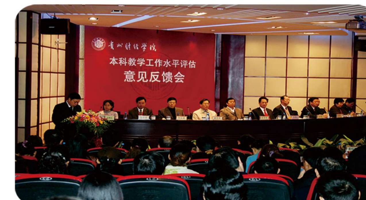
本科教学工作水平评估获“优秀”