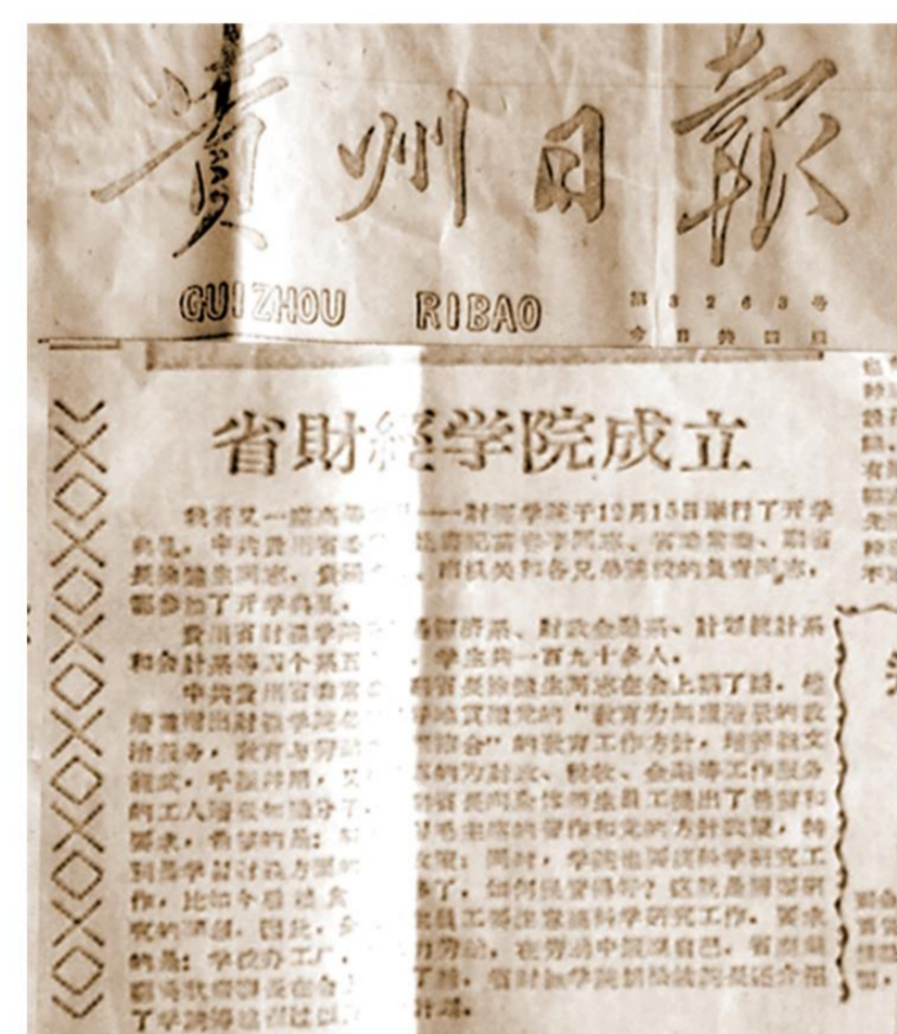
贵州日报对贵州财经学院成立进行报道