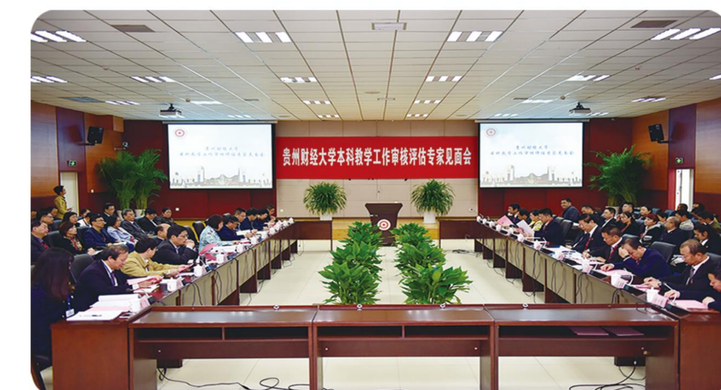
2016年本科教学审核评估专家见面会