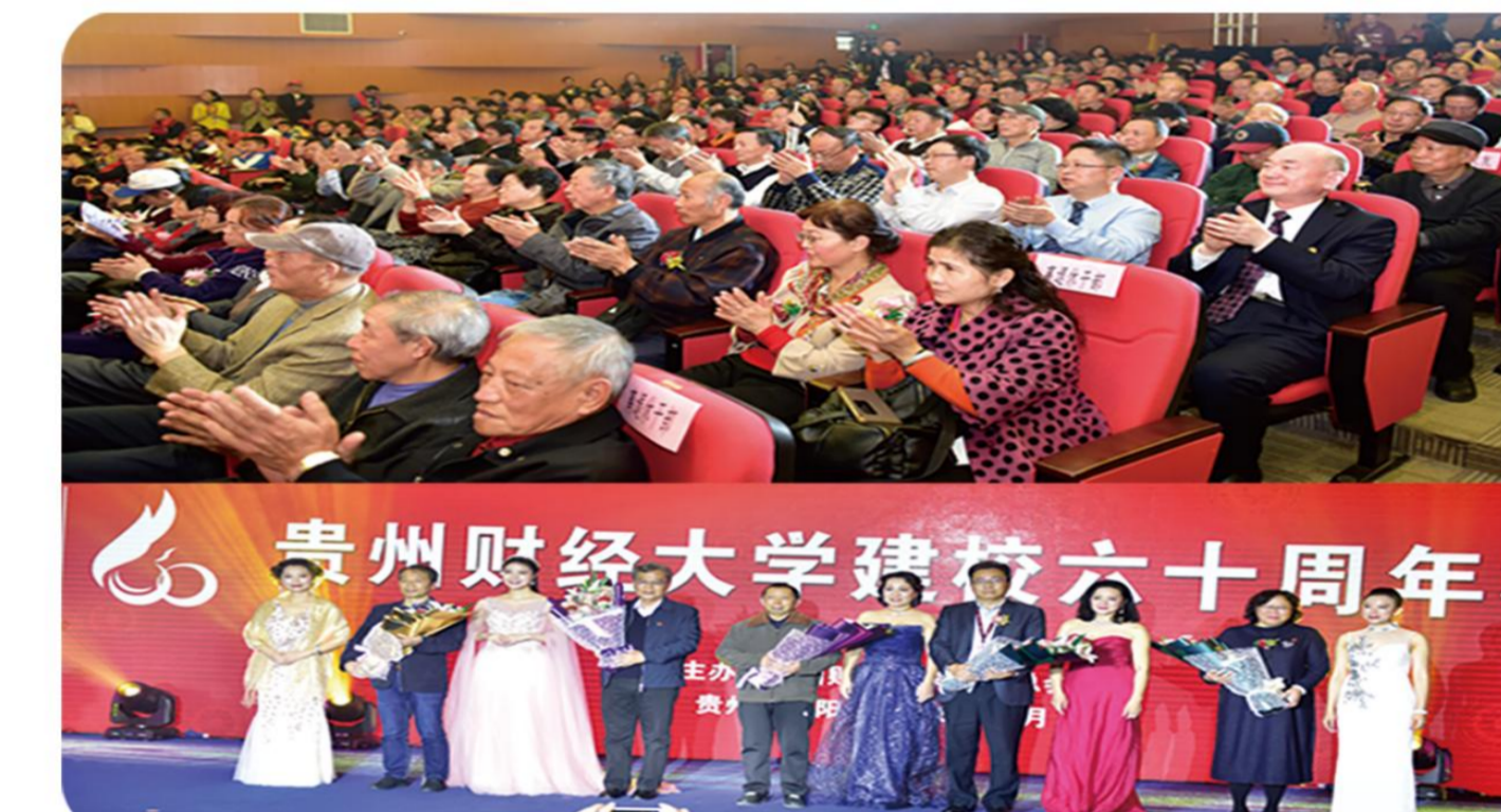
校领导观看建校六十周年校友联谊晚会