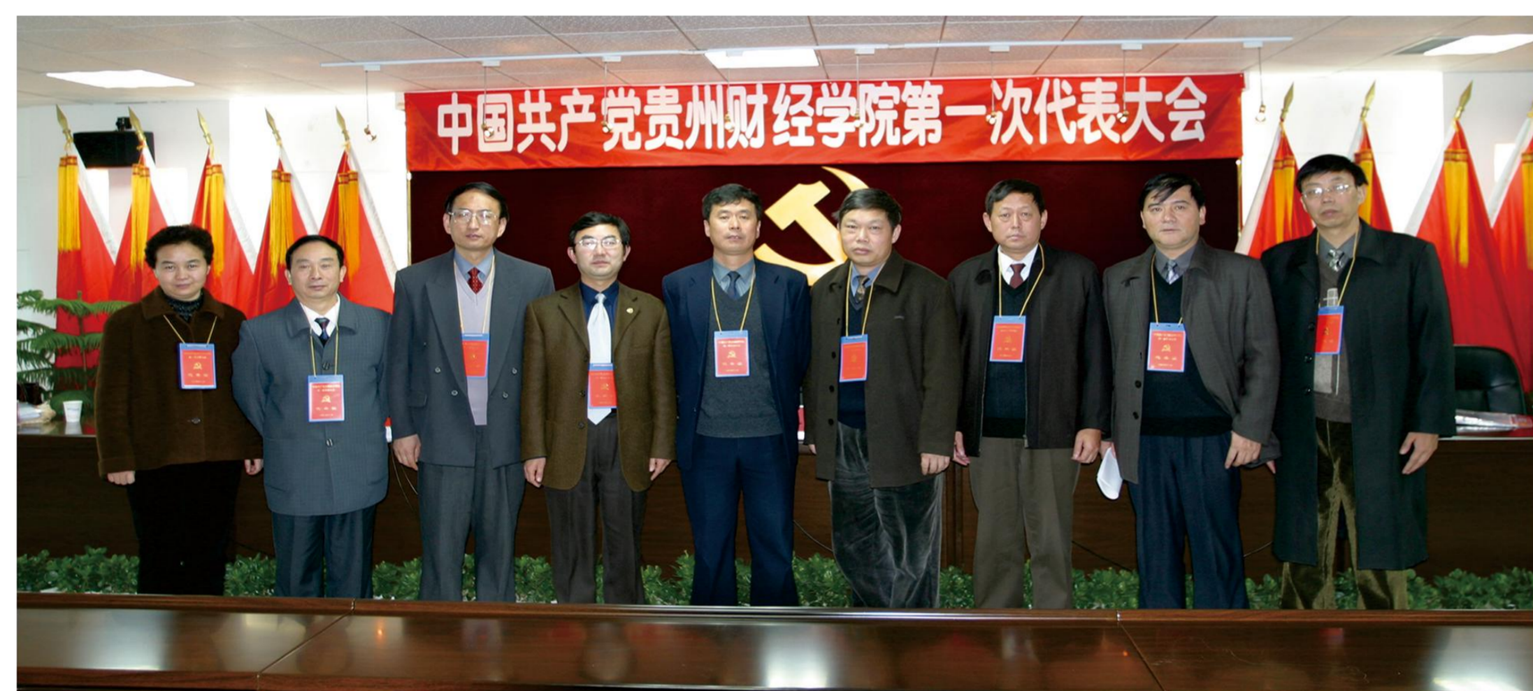
中国共产党贵州财经学院第一次代表大会选举产生新一届党委委员