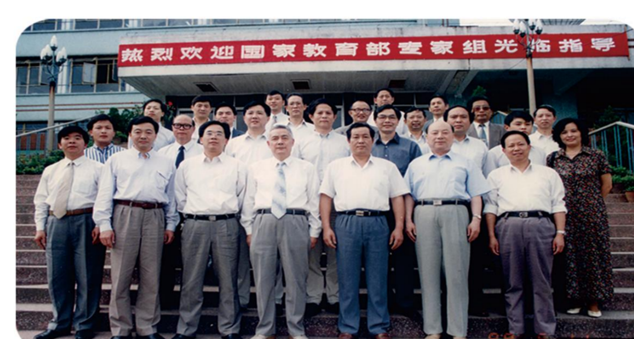
学校领导与教育部本科教学工作合格评估专家组成员合影