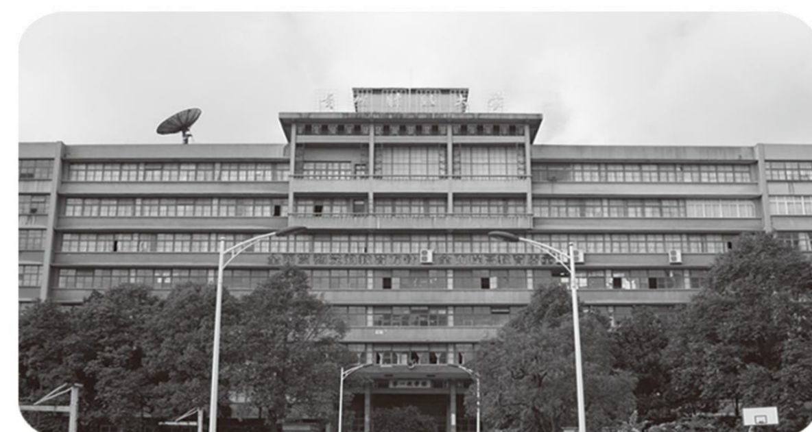
八层楼的教学大楼