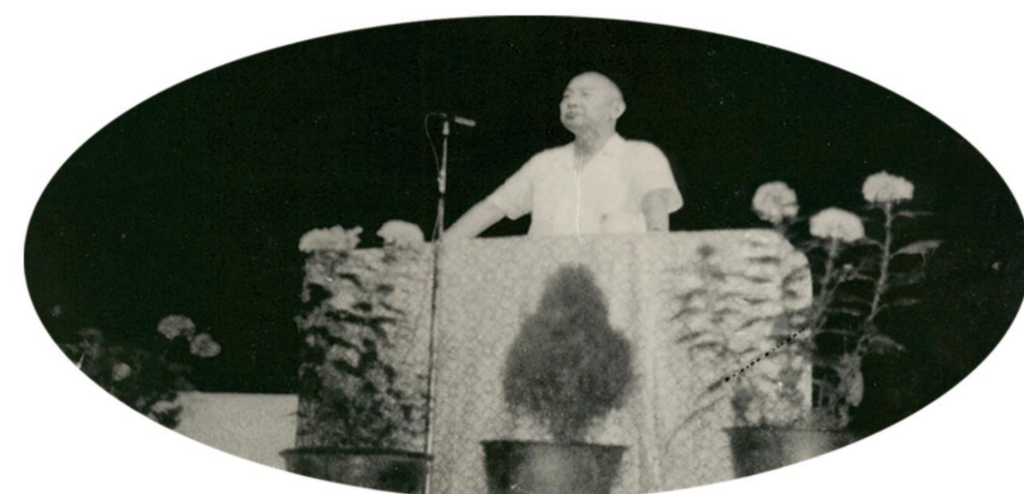
1978年11月，时任贵州省副省长申云浦在我校复校开学典礼上讲话