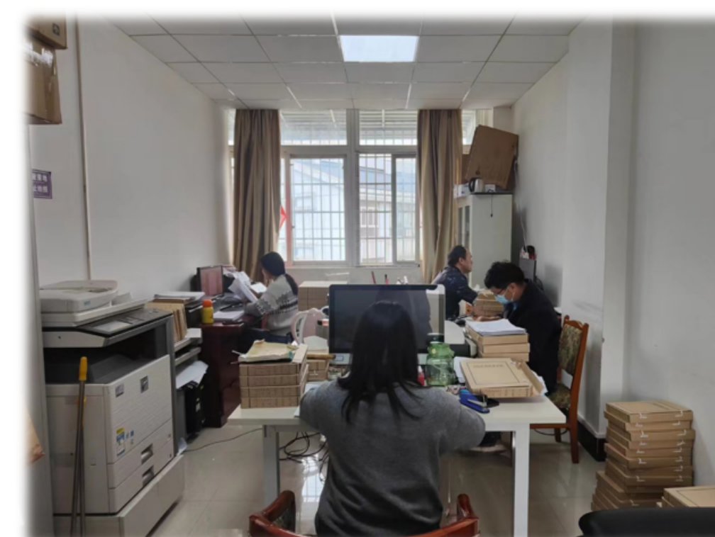
学校开展室藏档案数字化工作。