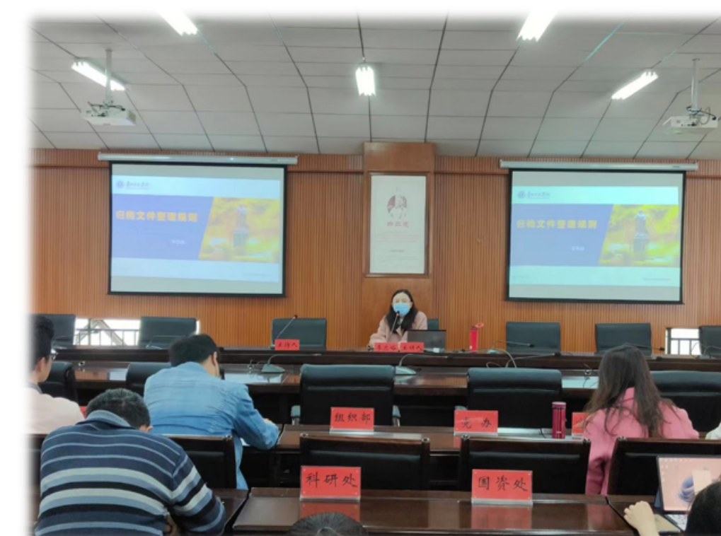
邀请贵州师范学院历史与档案学院档案学系教授为我校档案工作者培训。