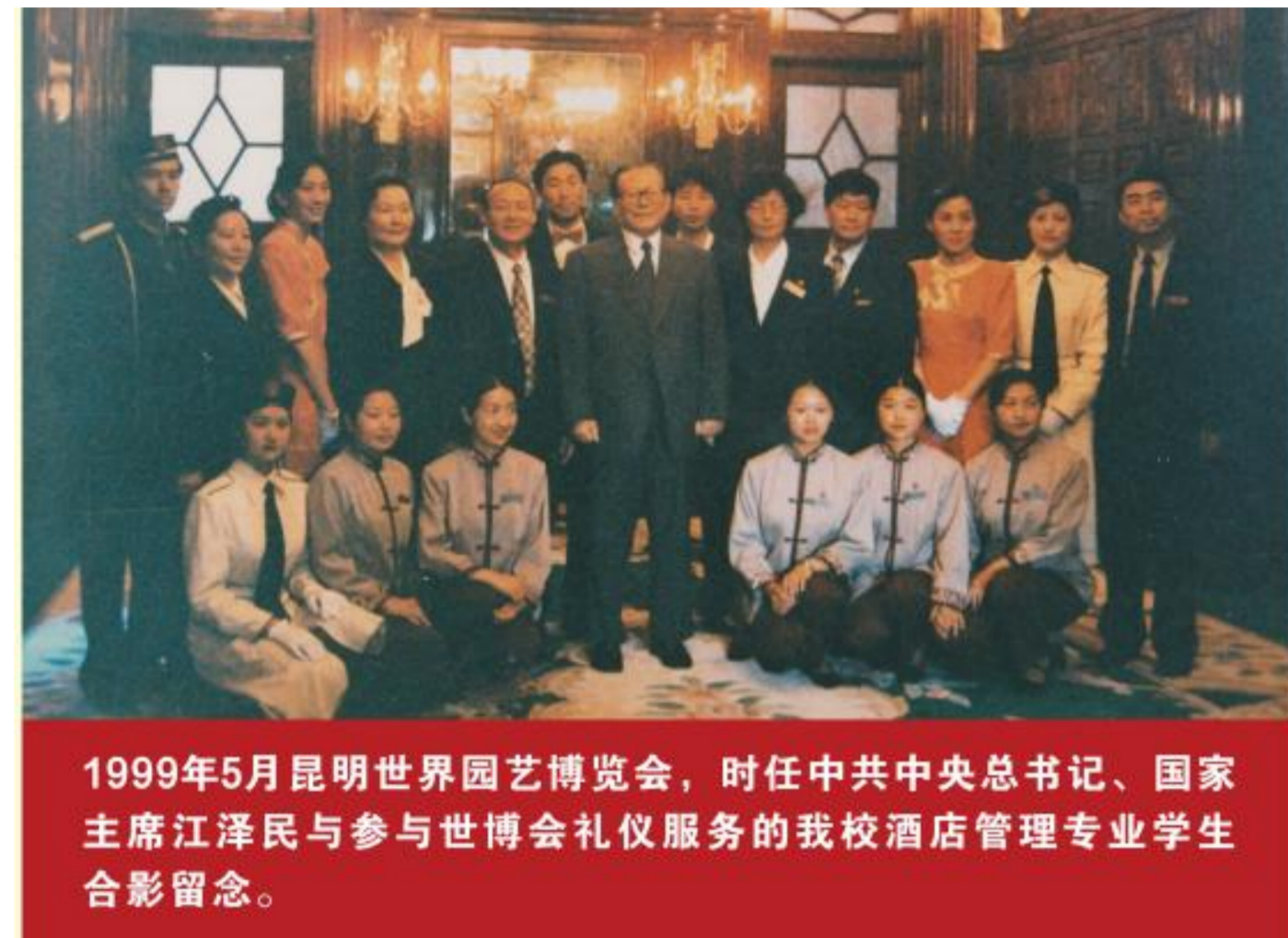
1999年5月昆明世界园艺博览会，时任中共中央总书记、国家主席江泽民与参与世博会礼仪服务的我校酒店管理专业学生合影留念。