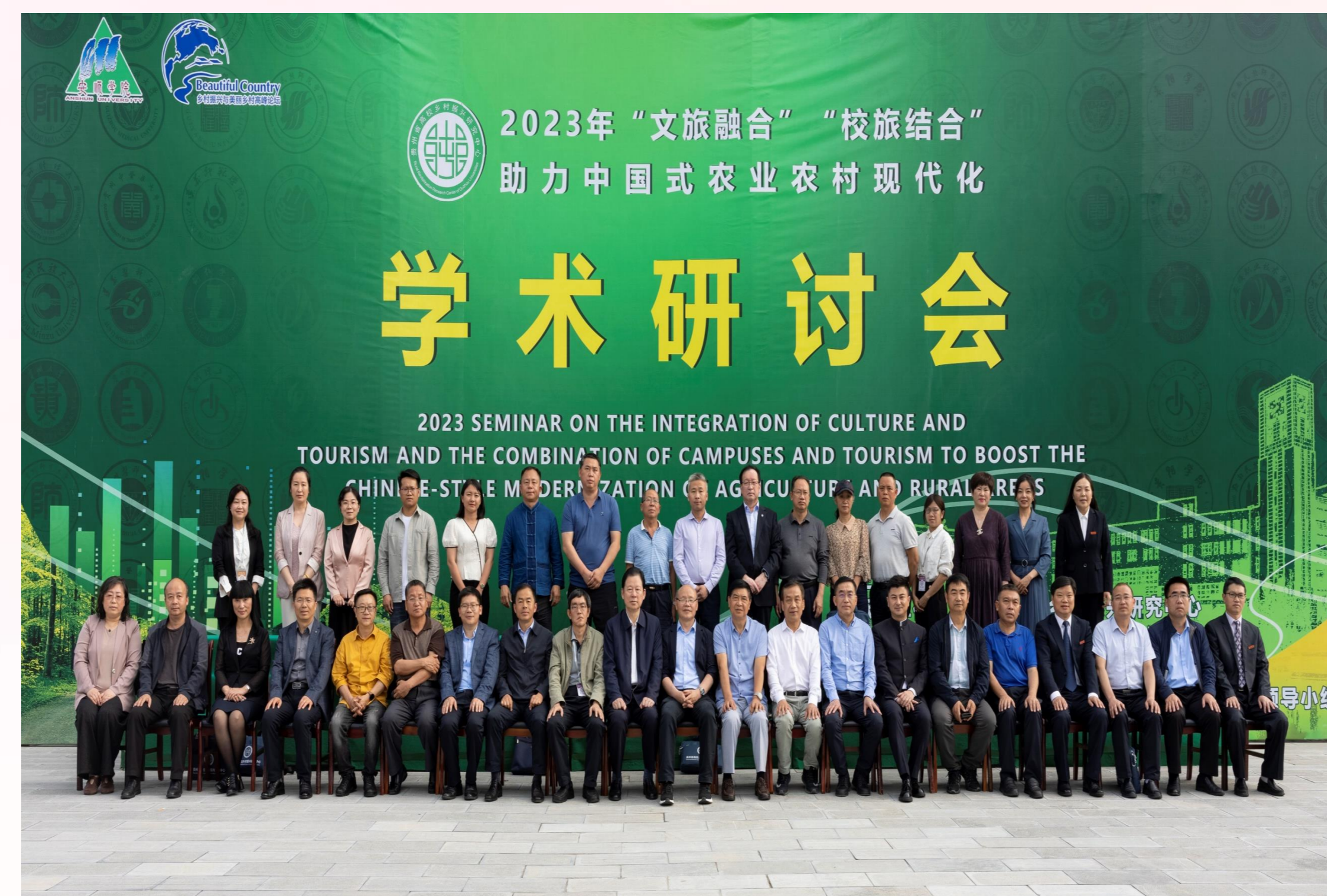
2023年5月18日，安顺学院举办“文旅融合”“校旅融合”助力中国式农业农村现代化学术研讨会