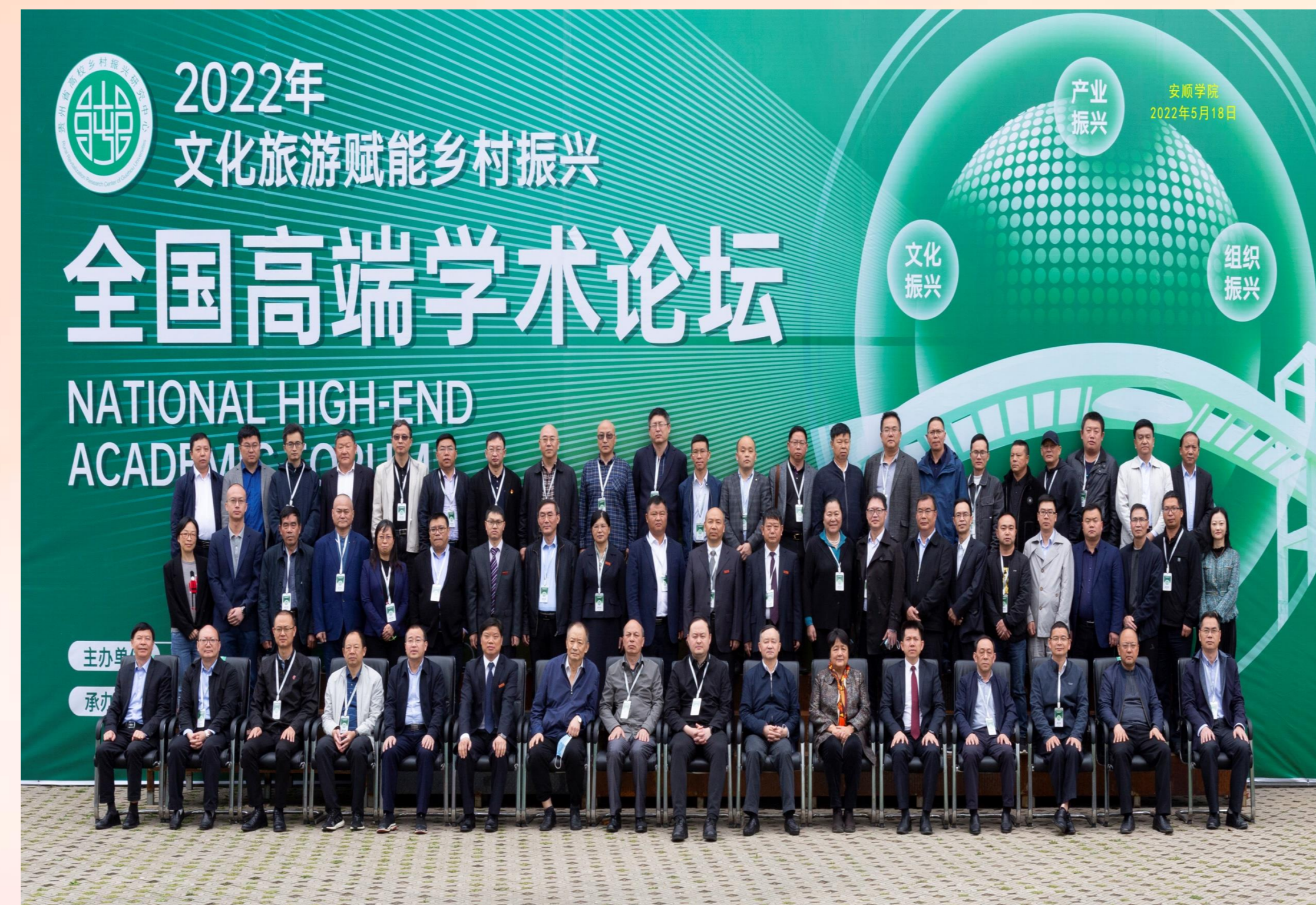
2022年5月18日，安顺学院举办文化旅游赋能乡村振兴全国高端学术论坛