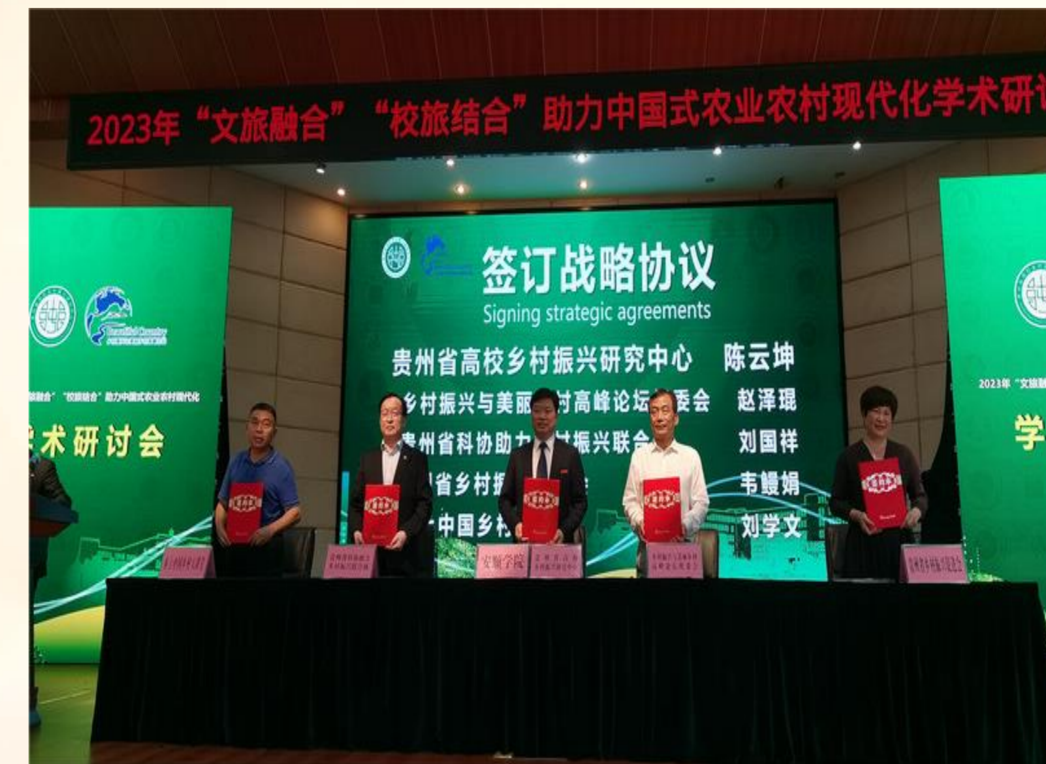
2023年5月18日，贵州省高校乡村振兴研究中心与乡村振兴相关机构开启跨界合作