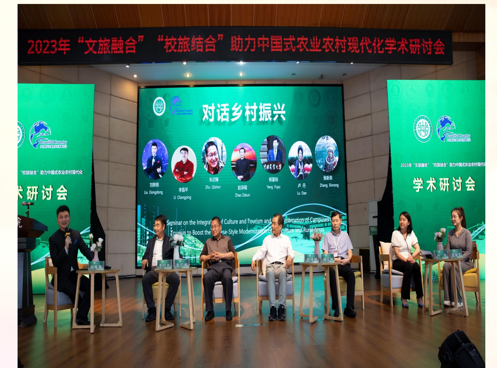
2023年5月18日，各领域代表与主持人围绕贵州乡村振兴发展未来开展对话活动