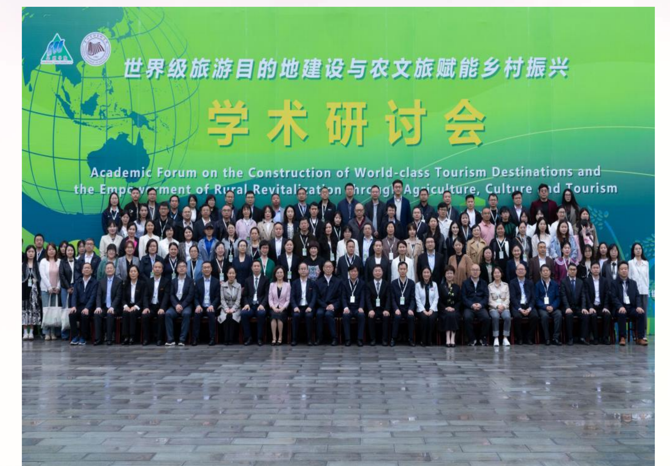
2024年5月18日，安顺学院举办“世界级旅游目的地建设与文旅赋能乡村振兴”学术研讨会