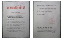
2004年铜仁地区苗圃场和地区林业培训中心并入铜仁师范高等专科学校