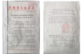
2006年4月铜仁师范高等专科学校改建为铜仁学院