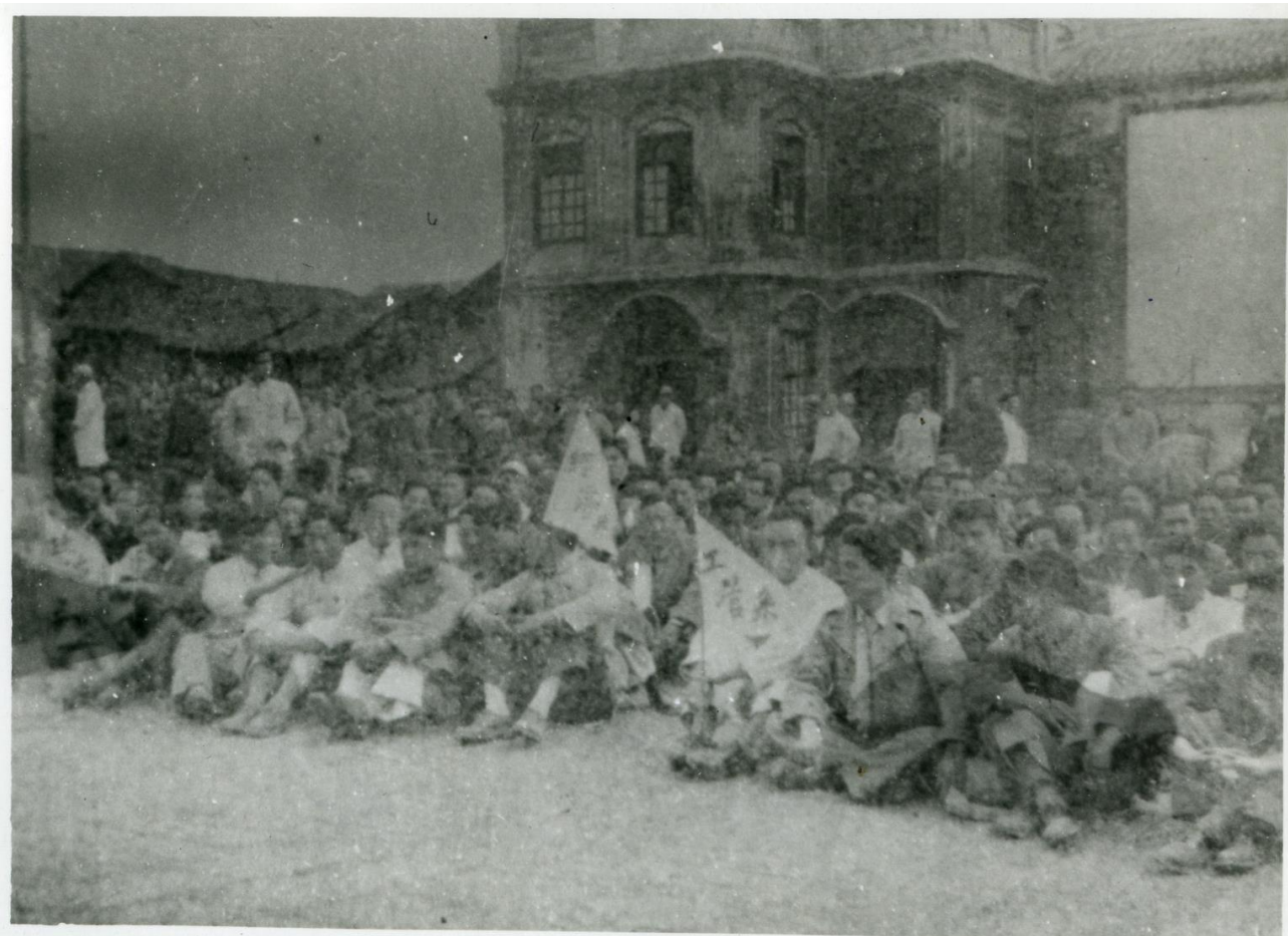
1949年3月26日反击饥饿游行，国立贵州大学学生从花溪步行至贵阳，在国民党贵州省政府大门一侧静坐。