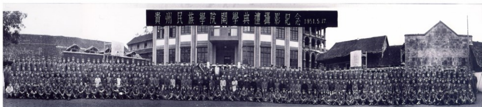
1951年5月17日，贵州民族学院开学典礼摄影纪念

1949年秋，在党中央、毛主席“将革命进行到底”的号召下，随中国人民解放军第二野战军五兵团渡江，接受了随二野进军西南、解放贵州的光荣任务。11月1日，第二野战军的三、五兵团及第四野战军的一部发起了进军川黔的战斗，解放了天柱、三穗、玉屏、镇远、铜仁等地。11月15日，五兵团解放了贵阳市。同时，中国人民解放军贵州军区于贵阳市成立。11月21日，三兵团解放了革命历史名城遵义。11月28日，五兵团又解放了川黔滇三省要冲毕节县城。十七军也解放了重镇安顺以及平坝、镇宁、普定等县城。12月21日，第二野战军刘伯承司令员、邓小平政委向川、黔、康、滇的国民党军政人员发布了停止抵抗、投向光明的号召。同日，国民党十九兵团和八十九军在普安、盘县宣布起义。12月下旬，十七军的一个师，奉命入滇支援作战。12月底，贵州全省大部获得解放。