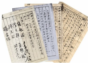
1950年11月16日，贵州民族学院成立文件（部分）